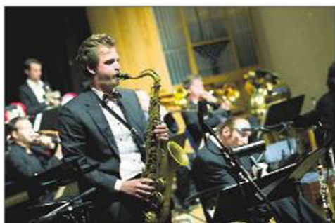
Bohuslän Big Band, enligt en i publiken Sveriges bästa storband. Enligt en annan världens bästa. Hursomhelst mycket bra.